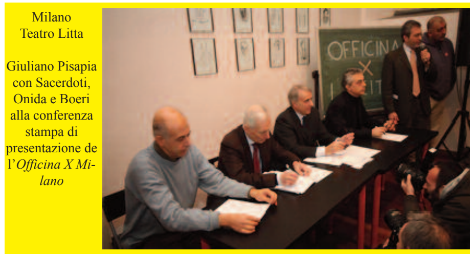
Milano Teatro Litta

cittametropolitana@pisapiaxmilano.it comunemodello@pisapiaxmilano.it finanza@pisapiaxmilano.it sviluppoeconomico@pisapiaxmilano.it coesionesociale@pisapiaxmilano.it cittadeidiritti@pisapiaxmilano.it legalita@pisapiaxmilano.it scuola@pisapiaxmilano.it universita@pisapiaxmilano.it cultura@pisapiaxmilano.it cittainternazionale@pisapiaxmilano.it http://www.pisapiaxmilano.com/officina-per-la-citta/